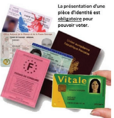
La présentation d'une pièce d'identité est obligatoire pour pouvoir voter.

Le jour du scrutin, nous vous rappelons de bien vouloir vous munir de votre carte électorale, accompagnée d'une pièce d'identité. Vous trouverez sur l'image ci-contre, les documents acceptés.